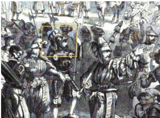
Abb. 1: Landsknechte bei der Musterung - Die illustrierte Welt. Blätter aus Natur u. Leben, Wissenschaft u. Kunst zur Unterhaltung u. Belehrung für die Familie, für Alle und Jeden - Bd 13

Für den 1842 in der preussischen Armee eingeführten Helm setzte sich in Deutschland sehr schnell die volkstümliche Bezeichnung „Pickelhaube“ durch. Schon Monate vor dessen Einführung, bereits in einem Artikel vom 22. Juli 1841, wurde der Vergleich zur mittelalterlichen Pickelhaube angestellt und damit der Name geprägt. So schreibt die Allgemeine Militär-Zeitung Nr. 63/1841 über die neue Helm-Form: „Sie sind den Pickelhauben aus den Ritterzeiten ähnlich.“; und weiter: „Eigenthümlich ist diesen neuen Helmen bei der Form derer des Mittelalters, daß sie oben auf der Mitte eine kegelförmige Spitze haben...“ 1 In späteren Zeitungsartikeln wurde das Aussehen der Pickelhaube zudem auch mit den „mittelalterlichen Kopfbedeckung der Fussknechte“ oder mit den „Sturmhauben deutscher Landsknechte“ verglichen. Hervorzuheben ist dabei der Umstand, dass der Wortteil „Pickel“ sich nicht direkt auf die Spitze des Helmes bezieht, sondern der Begriff „Pickelhaube“ eine Mundart der Bezeichnung „Beckenhaube“ war.