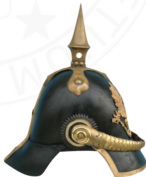
Abb. 2 - Pickelhaube M42 aus privater Sammlung (Herzlichen Dank an kaisersbunker.com)

Das stattliche Erscheinungsbild eines Soldaten hatte zur damaligen Zeit mehr Gewicht als Heute, daher wurde das Thema auch in fast allen Zeitungsberichten, die ich für diesen Artikel recherchiert habe, angerissen. Allgemein war die Meinung über ihr Aussehen Anfangs noch gespalten 2 , später wurde die Pickelhaube jedoch als zweckmäßig und kleidsam erachtet. 3 Die Soldaten und Militärs weltweit lernten die Vorteile des Helmes schnell zu schätzen, und so wurde er nach und nach in vielen Armeen der Welt eingeführt. 4