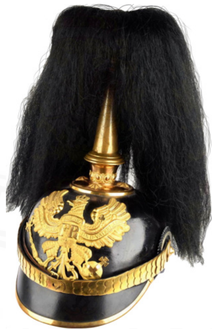
Abb. 6: Offiziershelm mit Paradebusch (aus privater Sammlung)

Zu Paraden trugen viele Regimenter seit jeher prächtige Haar- oder Feder-Büsche an ihren