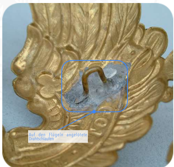
Bild 13 - Rückseite Helmadler M1895

In der Gestaltung entsprach der Helmadler M1895 so ziemlich dem Helmadler M1887/91, jedoch mit einem neuen Befestigungskonzept. Dafür wurden auf der Rückseite des Helmadlers 2 Drahtschlaufen angelötet (Bild 13), die dann durch metallene Ösen am Helm geführt und der Helmadler dann mit 2 einfachen Lederkeilen am Helm fixiert wurde. Dieses Befestigungskonzept wurde bis zum Ende der Pickelhaube am Mannschaftshelm beibehalten.