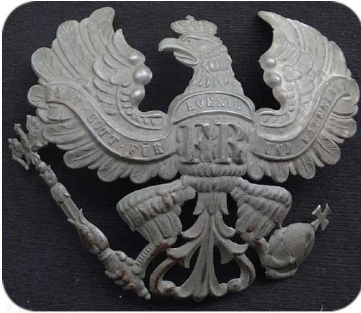
Bild 14 - Helmadler M1915

Den Helmadler M1915 möchte ich erwähnen, aber nicht groß darauf eingehen. Er war nahezu identisch mit dem Helmadler M1895, wegen des Materialmangels im Krieg wurde er jedoch aus Stahl gefertigt und durch eine chemische Behandlung ergraut (Bild 14). Diese Oberflächenbehandlung war leichter und beständiger als ein Farbauftrag und war eine Antwort auf das bekannte Problem mit den reflektierenden Beschlägen und den feindlichen Schützen. Erwähnenswert ist noch, dass die Herstellungsqualität im Krieg deutlich abgenommen hat. Die Details sind bei vielen Kriegsproduktionen lange nicht so deutlich ausgearbeitet, wie bei den Produktionen der Vorkriegszeit.