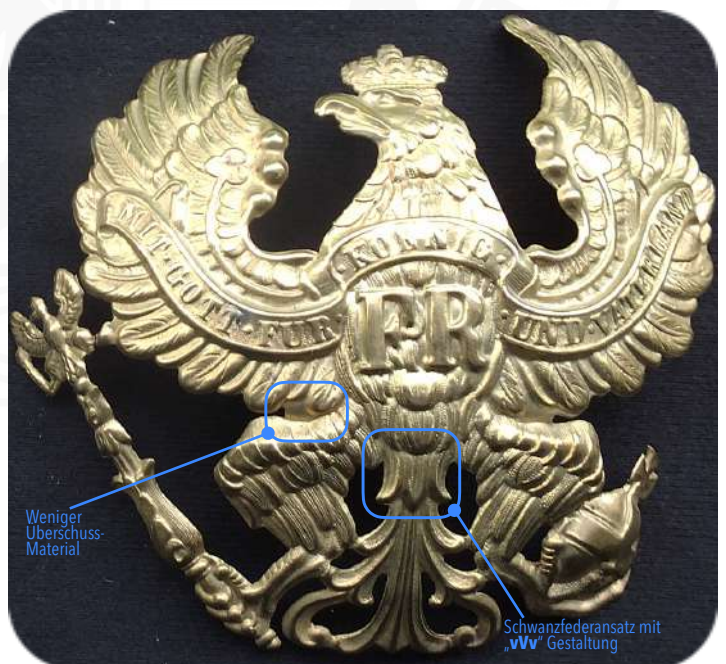
Bild 11 - Helmadler M1871

So ist das Überschuss-Material zwischen Flügeln und Beinen wegen der Fortschritte in der Metallverarbeitung etwas kleiner geworden und auch der Schwanzfederansatz wurde wieder umgestaltet. Dem Zeitgeschmack entsprechend wurden die Federn nun etwas schnittiger dargestellt (Bild 11). Der Ansatz sah nun etwas aus wie 3 nebeneinander stehenden „v“, wobei das mittlere „v“ größer ist und das Design deshalb das Kürzel „ vVv “ erhält.