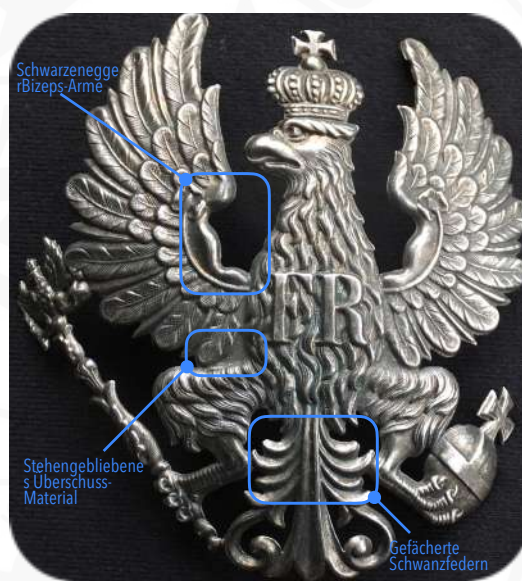
Bild 2 - Gepresster Helmadler M1842/43

Da die Hersteller damals noch nicht in der Lage waren kleine Zwischenräume ohne viel Aufwand freizuschneiden, blieb nach dem Pressen zwischen den Flügeln und Oberschenkeln der Helmadler immer noch einiges an überschüssigem Material stehen. Eine Nacharbeit wäre zweifelsfrei möglich gewesen, doch der Aufwand wäre nicht unerheblich und die Kosten damit zu hoch. Da es zudem nicht groß auffiel verzichteten die sparsamen Preussen auf diesen Arbeitsschritt und ließen das Überschuss-Material stehen. Der auf Bild 2 gezeigte ist der verbreitetste Helmadler für Mannschafts- und Offiziershelme. Es gibt noch weitere Varianten des Helmadlers M1842/43, mit größeren Abweichungen am Schwanzfederansatz, aber dieses waren, soweit ich das in Erfahrung bringen konnte, ausschließlich Landwehradler. Daher vermute ich das es alles nur Helmadler von Eigentumshelmen waren.