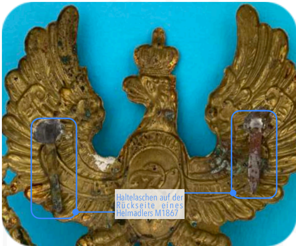
Bild 9 - Befestigungslaschen eines Helmadlers M1867

Auf Bild 10 ist zudem schön zu sehen das die Helmschalennaht der Pickelhaube M1867, sofern die Schale nicht aus einem Stück gefertigt, auf die Vorderseite wanderte, wo sie grösstenteils vom Helmadler verdeckt wurde. Dieser Schritt war notwendig, da auf der Rückseite des Helmes M1867 die Hinterschiene ja zwecks Gewichtsreduzierung entfallen ist und man auf der nun komplett sichtbaren Fläche keine hässliche Naht sehen wollte.