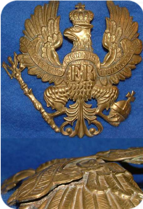
Bild 5 - Helmadler M1842/43 mit nachträglich aufgebrachtem Spruchband

Als am 10. Mai 1860 das Spruchband eingeführt wurde, wurden die bereits existierenden Helmadler oft nachgearbeitet. Die Spruchbänder platzierte man so gut es ging auf den verhältnismäßig schmalen Flügeln und lötete sie an. Dafür wurden mehrere kleine Löcher in den Helmadler gebohrt, damit das Lot sich ordentlich unter dem Spruchband verteilen konnte und die Lötstellen für lange Zeit Bestand hatten (Bild 5+6). Es gibt aber auch Helmadler in der Art des M1842/43 mit einem eingepressten Spruchband (Bild 7). Diese wurden wahrscheinlich nur bis kurz nach Beginn der Spruchbandeinführung hergestellt, denn mit dem Helm M1860 wurde auch ein etwas niedrigerer Helmadler mit einer veränderten Gestaltung eingeführt.