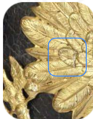
Bild 3 - Befestigung Helmadler M1842/43 mit Durchsteckbolzen (Diese Methode wurde jedoch nur bis kurz nach 1860 angewandt)

Zur Befestigung am Helm wurden entweder Gewindebolzen mit einem Tarnkappen-Kopf durch 2 dafür eingebrachte Bohrungen in den Flügeln gesteckt (Bild 1+3) und im Helm mit Vierkant-Bügelmuttern verschraubt, oder es wurden rückseitig 2 Gewindestifte angelötet und ebenfalls mit Vierkant-Bügelmuttern verschraubt (Bild 4). Die Tarnkappen-Köpfe der Durchsteckbolzen wurden oft an das durch die Bohrung im Helmadler fehlende Federbild angepasst, was mal mehr und mal weniger gut gelang (vgl. Bild 1+3). Manche Tarnkappen-Köpfe sind aber echte Kunstwerke, die mir immer wieder zeigen wie stolz die damaligen Handwerker auf Ihre Arbeit waren.