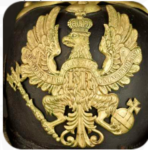
Bild 7 - Helmadler M1842/43 mit in Pressung integriertem Spruchband