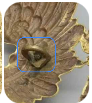
Bild 4 - Befestigung Helmadler M1842/43 mit angelötetem Gewindestift