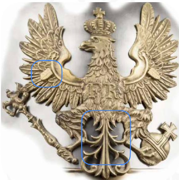
Bild 1 - Gegossener Helmadler M1842/43

Der Linien-Helmadler des Helmes M1842, M1843 und des M1857 ist 12,5 cm bis 13,0 cm hoch und leicht anhand den breit gefächerten Schwanzfedern und den muskulösen Bizeps-Armen zu erkennen (Bild 1+2). Ganz zu Beginn wurden auch gegossene Helmadler aus Messing verwendet (Bild 1), davon nahm die Armee wegen des hohen Gewichts jedoch schnell wieder Abstand. Das Design des gegossenen und des gepressten Helmadlers M1842 war ähnlich, die gegossenen Modelle waren aber aus Vollmaterial und sind an der glatten Rückseite zu erkennen.