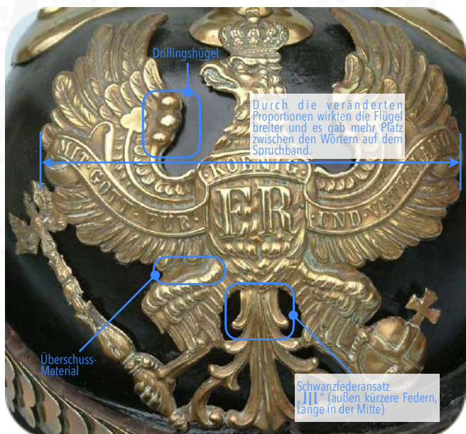
Bild 8 - Helmadler M1860

Größere Änderungen gab es auch bei den Schwanzfedern. Dort wurden die breit gefächerten Federn durch eine vereinfachte Darstellung mit kurzen Federn Außen und langen Schwanzfedern in der Mitte abgelöst (kurz „||“).