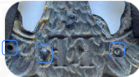
Bild 6 - Rückseite eines Helmadlers M1842/43/57, mit Lötstellen für ein nachträglich aufgesetztes Spruchband