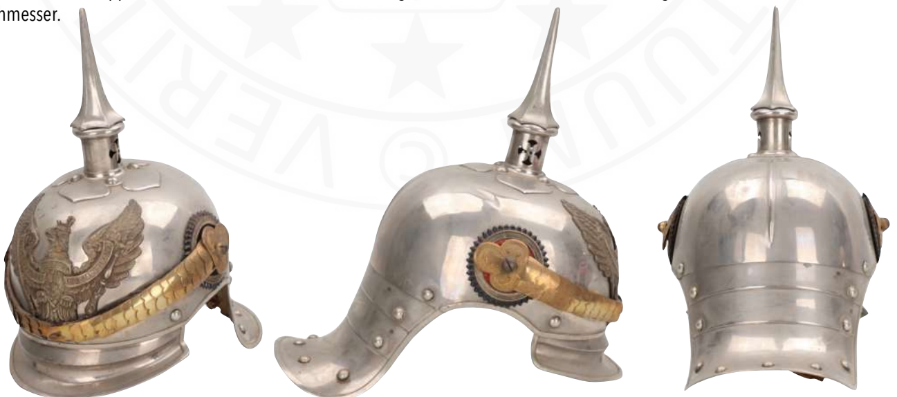
BILD 22: BEISPIEL M1889 OFFIZIERSHELM DER JÄGER ZU PFERD NR. 1-4 UND 7