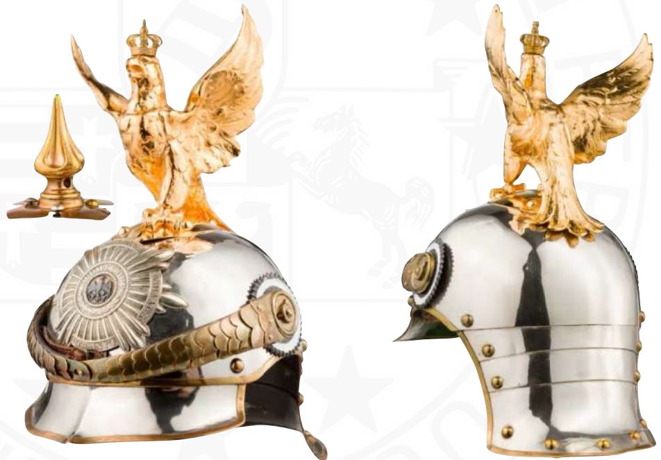
BILD 19: M1894 MANNSCHAFTSHELM DER LEIB-GENDARMERIE