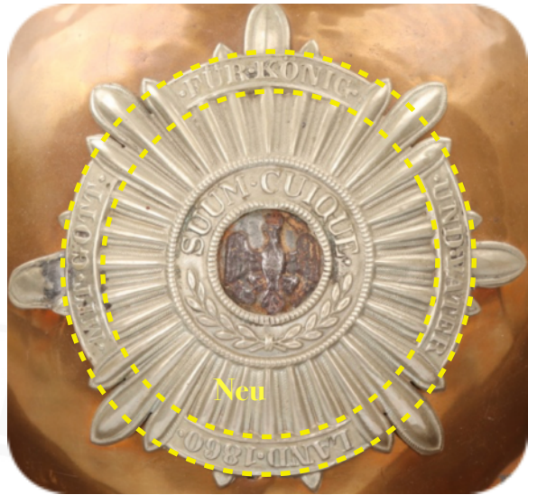
BILD 8: M1860 GARDE DU CORPS STERN MIT DEVISENBAND