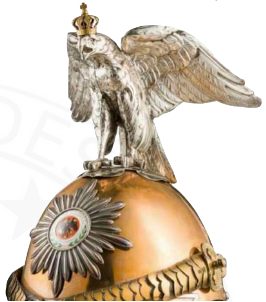
BILD 6: PARADEADLER M1843 OFFIZIERSHELM