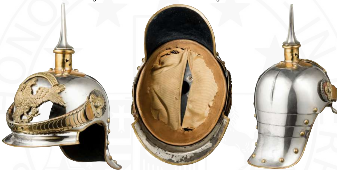
BILD 15: M1889 OFFIZIERSHELM UM 1900