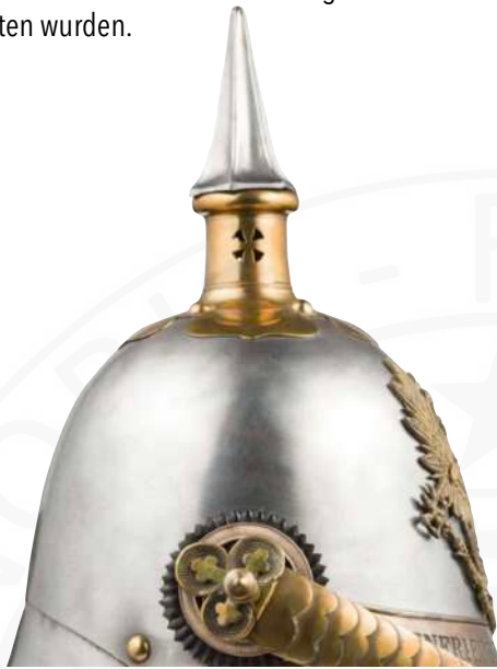
BILD 5: M1843 OFFIZIERSHELM