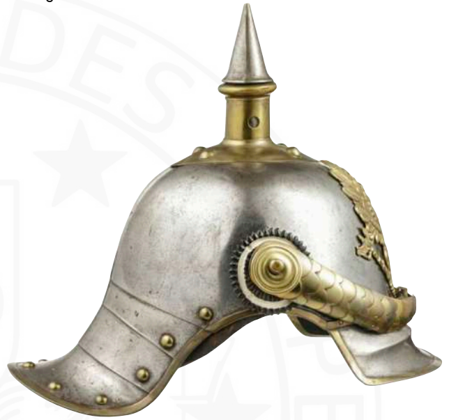
BILD 12: M1867 MANNSCHAFTSHELM