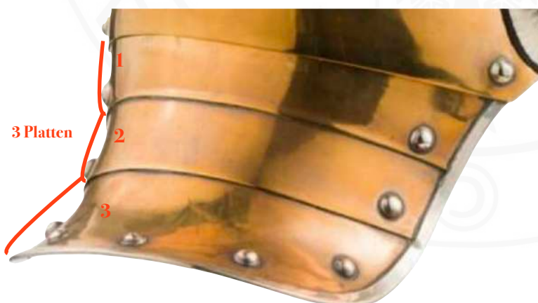
BILD 2: M1843 HINTERSCHIRM (MIT FREUNDLICHER GENEHMIGUNG VON HERMANN-HISTORICA.COM)