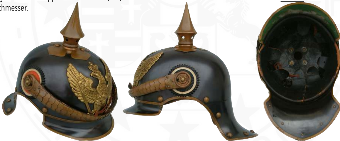
BILD 23: BEISPIEL M1894 MANNSCHAFTSHELM DER JÄGER ZU PFERD NR. 8-13