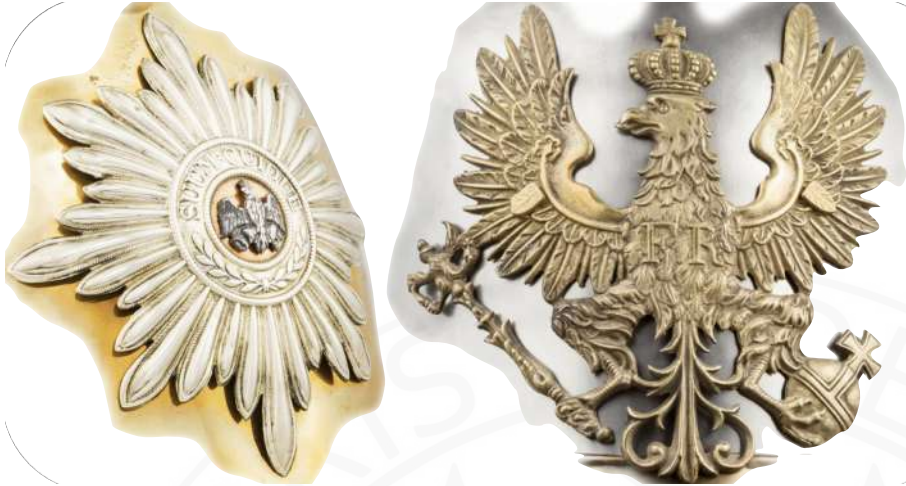
BILD 3: M1843 GARDESTERN UND HELMADLER FÜR MANNSCHAFTEN

dem auf Bild 3 gezeigten Adler wurden Befestigungsschrauben zum Beispiel von außen durch den Wappenadler durchgesteckt. Die Köpfe der beiden Schrauben wurden sehr detailliert als Federn gestaltet, um sie so unauffällig wie möglich aussehen zu lassen. Das zeigt nochmal wie viel Wert die damaligen Verantwortlichen auf Aussehen und Qualität legten.