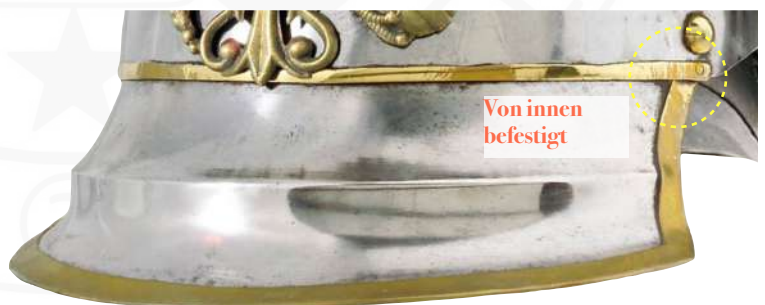
BILD 7: M1853 VORDERSCHIRM VOM MANSCHAFTSHELM DER LINIEN-KÜRASSIERE

Im Laufe der Gebrauchszeit zeigte sich am M1843 ein schwerwiegender Nachteil des von außen angenieteten Vorderschirms. Durch einen Spalt zwischen Schirm und Helmkopf tropfte bei Regen Wasser ins Gesicht des Trägers, weshalb der Schirm bei Neubeschaffungen künftig von innen angenietet wurde (Bild 7). Damit entfiel die bisherige Einfassung um den oberen Rand des Vorderschirmes und der Schirm maß in der Höhe nur noch 7,2 - 7,3 cm und in der Breite 21,0 - 21,6 cm. Eine diesbezügliche AKO ist leider nicht bekannt, jedoch ist dieses Helmmuster als M1853 bekannt und die Änderungen betrafen die Manschafts- und die Offiziershelme .