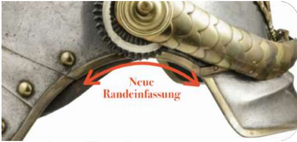
BILD 11: M1867 MANNSCHAFTSHELM