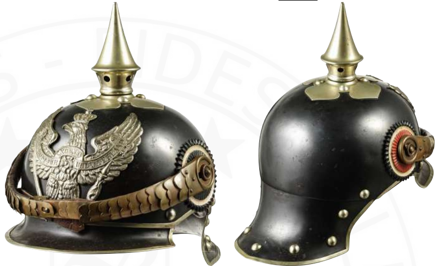
BILD 21: BEISPIEL M1894 MANNSCHAFTSHELM DER JÄGER ZU PFERD NR. 1-4 UND 7