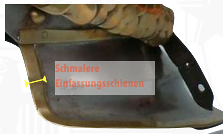
BILD 9: M1862 VORDERSCHIRM