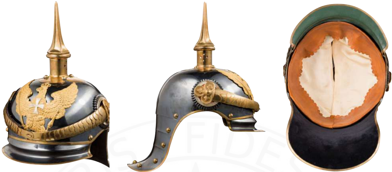
BILD 24: BEISPIEL M1889 OFFIZIERSHELM DER JÄGER ZU PFERD NR. 8-13