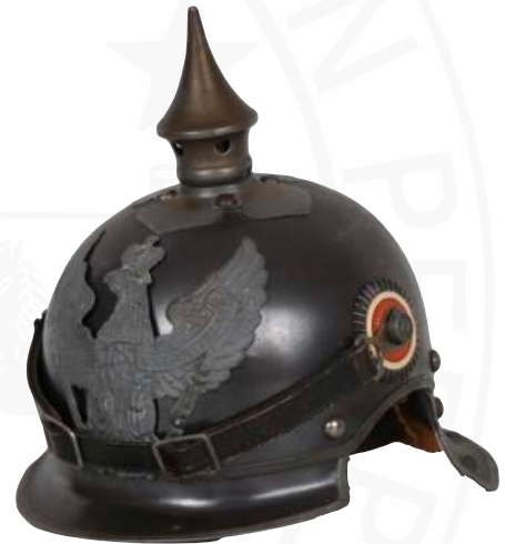
BILD 25: BEISPIEL M1915 MANNSCHAFTSHELM DER JÄGER ZU PFERD

Die Änderungen des Helmmusters M1915, die per AKO vom 21.9.1915 befohlen und zuvor schon für den Kürassier-Helm beschrieben wurden, galten analog auch für den Helm M1915 der Jäger zu Pferd (Bild 25) .