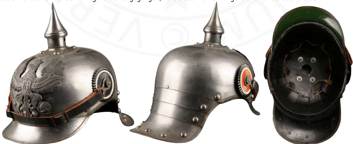
Bild 18: M1915 Kürassierhelm für Mannschaften