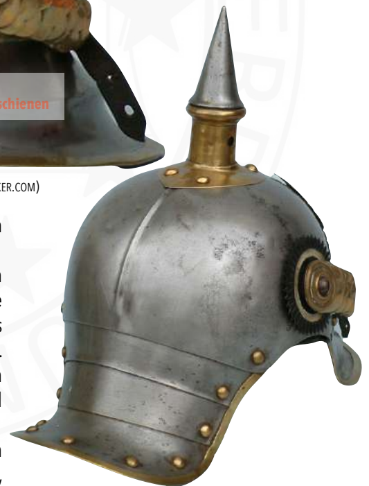
BILD 10: M1862 MANNSCHAFTSHELM HA

Letztlich brachten diese Änderungen jedoch nur eine Gewichtserleichterung von wenigen Gramm.